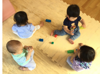
広いお部屋なのに 気付いたらみんな近くに!