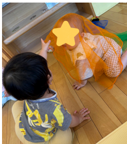
いないいない・・・ ばあ!!