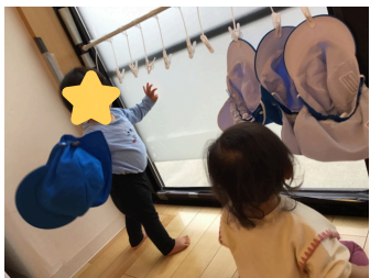
帽子引っ張るのが 楽しくて・・・♡

4月当初、保育者から離れられなかった姿が今では近くに保育者がいることを確認しながら、少し離れた場所へと探索したり保育者の方を見て目を合わせるとニコッと可愛らしい笑顔を見せてくれたりしています。音の鳴るおもちゃを手を持つと自分なりに振って楽しむ姿やキラキラ星を歌いながら手遊びをすると保育者の手の動きを真似する姿も見られています。また、周りの存在に気づきオーガンジーで顔を隠している子どもに手を伸ばしオーガンジーを引っ張ると友だちの顔を見つけ、笑い合う様子も見られ始めています。「いないいないばあ！」と言葉に出してあげることで、繰り返し楽しさを味わっているところ